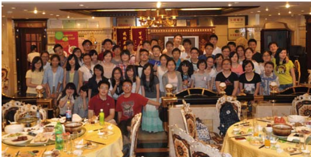
2013届5班全体同学合影

于是乎，一场在操场上的史无前例的露天毕业典礼如期举办，天公作美没有下雨，同时炎热的夏季似乎也