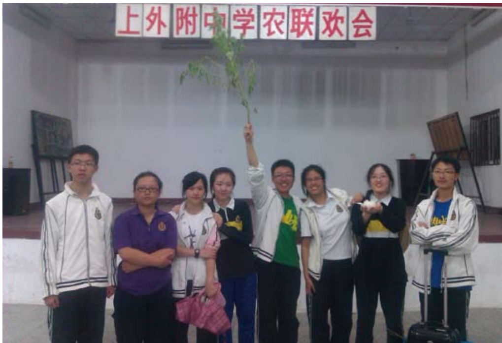
高二学农联欢会短剧演职人员合影

最后还是想再次感谢下附中七年这段奇妙的旅程，感谢学校、老师与同学的栽培、呵护与帮助。作为2013届校友会的理事与联络人，我也深知身上的责任重大，也期待着用更好的成绩来回馈母校七年的“养育之恩”。