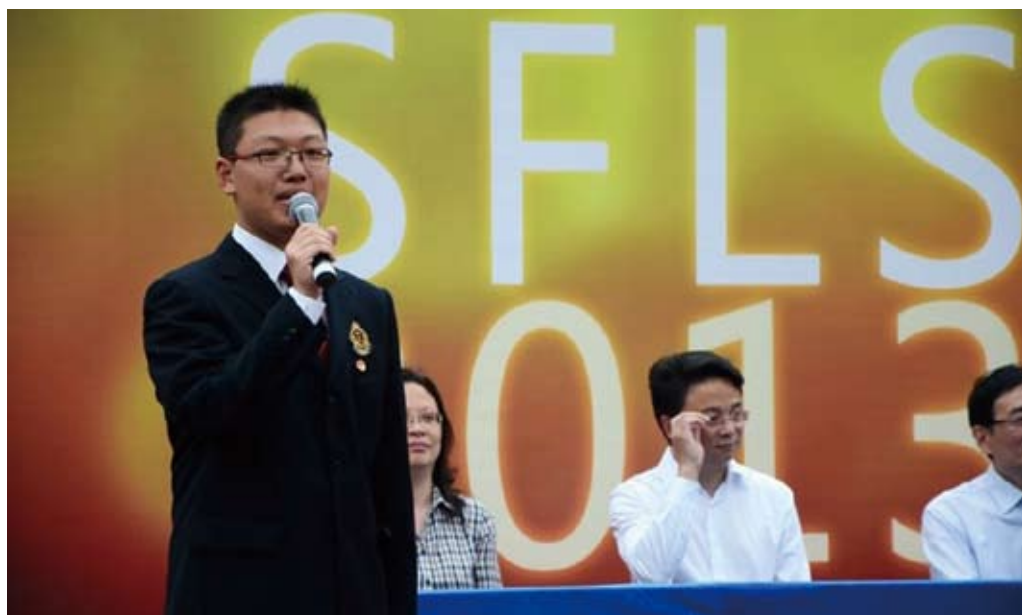
作为高三毕业生代表在毕业典礼上发言

在附中，我第一次来到香港喇沙书院了解“一国两制”背景下的教育制度，第一次来到美国圣路易斯MICDS中学开启一段跨文化交流之旅，