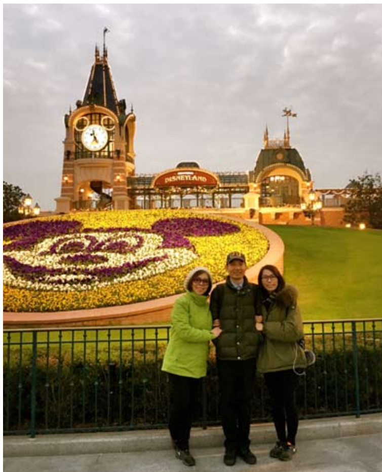
我们仨迪士尼合照 / 母亲节思维导图

不知是上天的眷顾，亦或是缘分使然，2020年末我有幸步入了复旦哲学系王德峰教授的课堂。在云雾缭绕中，当王教授提到现代人无处安顿心灵的那一刹那，一语惊醒梦中人，犹如被重启一般，我沉浸在儒释道的箴言中，感悟着中国智慧关于生命意义的诠释。人心无限的一面，注定了我们无法安于现状，始终在以筹划未来的方式活着。然而，正视烦恼与焦虑，才体现出人心的伟大。