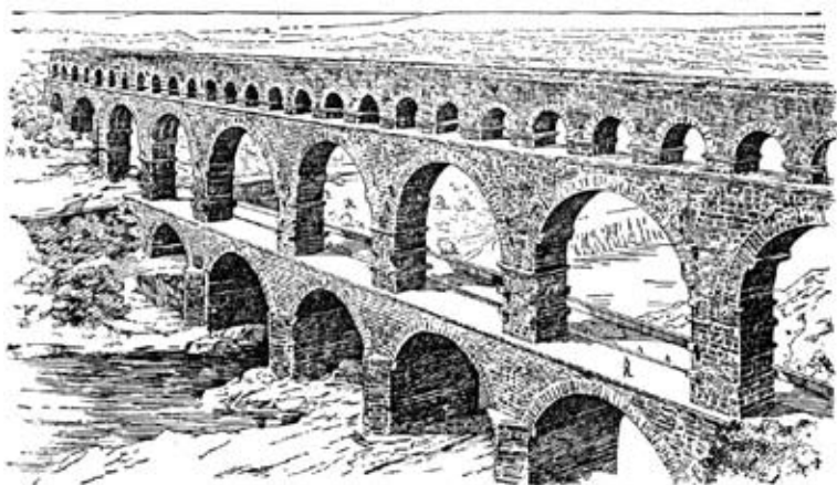
公元一世纪，法国南部Le Pont du Gard，罗马帝国建造的上水道

放眼今日，已有迹象。香草口味大都是人工合成的香精，因为天然香草的收成越来越少；全球124种咖啡，75种有灭绝风险，阿拉比卡和罗布斯