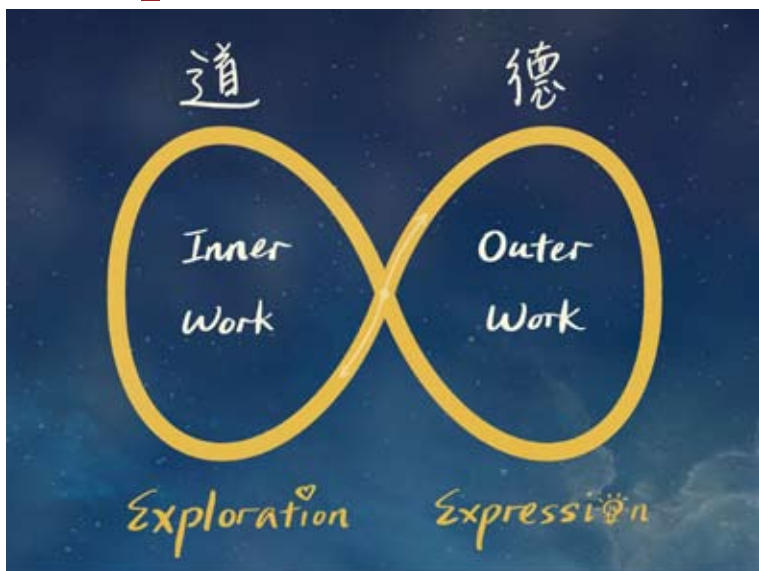
Infinity Sign Sketch)

烦恼即菩提 (pain is a gift)，若不是经历失去挚爱的痛楚，想必平凡如我定不会跌落谷底，又踏上开悟之坡，收获了无限符号 \infty 之于生命之旅的启迪。此时此刻，生命之旅于我而言，不再是一条直线，而是始于原点（中心点），历经向内和向外两个循环后，最终回归原点，为这段曼妙的旅程画上圆满的句号。