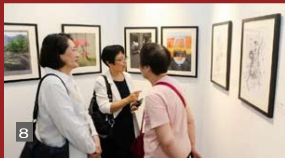
图1 杜校长和杭副校长等校领导参观展览