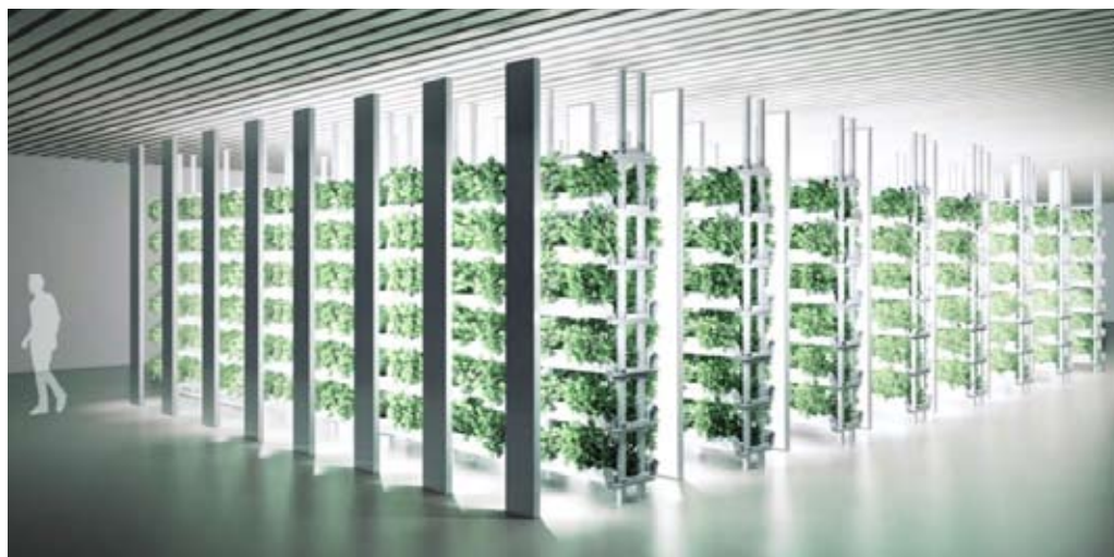
2020年，加拿大，垂直农场